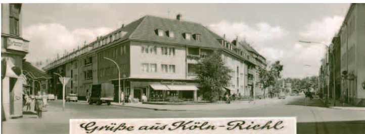
Stüssgen-Markt Riehler Tal 2 – heute Fontane Apotheke